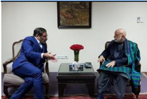
علی شمخانی در سفر به کابل و در دیدار با حامدکرزی

پایه های برقراری امنیت در منطقه بوده است و بدون شک همکاری های مشترک دو کشور در رفع مشکلات امنیتی امروز افغانستان بسیار کارگشا خواهد بود. مشاور امنیت ملی با ارایه گزارشی از شرایط سیاسی، نظامی و امنیتی افغانستان افزود: برگزاری موفقیت آمیز انتخابات در افغانستان نشان دهنده علاقه مندی مردم برای مشارکت در تعیین سرنوشت خود با وجود همه تهدیدات و مشکلات امنیتی موجود است.